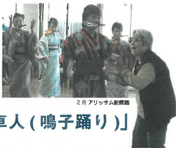
2月 アリッサム新舞踊