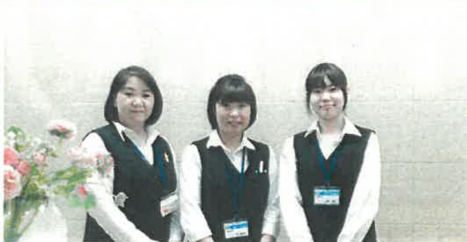
制服も新しくなり、心機一転リフレッシュ！

受付窓口や診療費の計算・精算をはじめとして、診断書等の発行・医療保険・介護保険・自賠責保険・労災保険などの診療報酬請求を行っています。