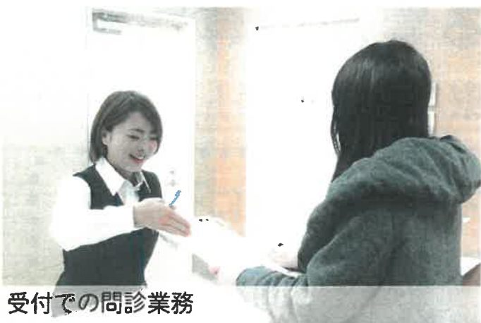
受付での問診業務