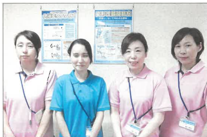
医療リハビリアシスタント