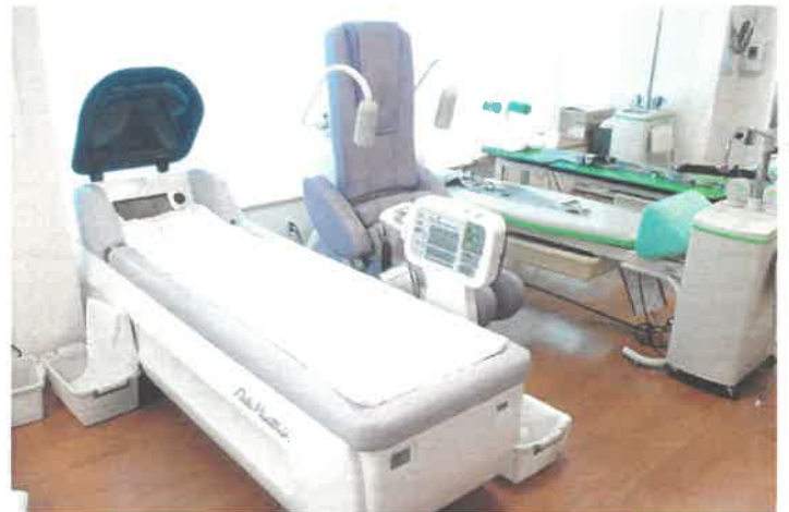
医療リハビリ機器