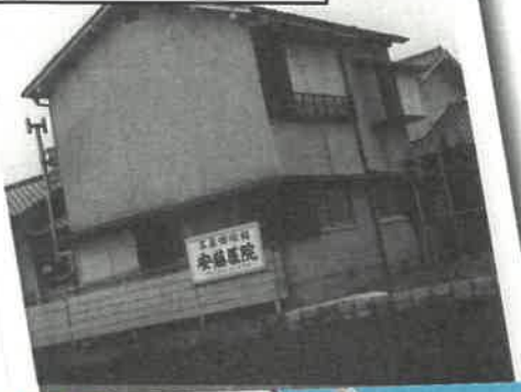
安藤医院（耳鼻科） 昭和41年頃