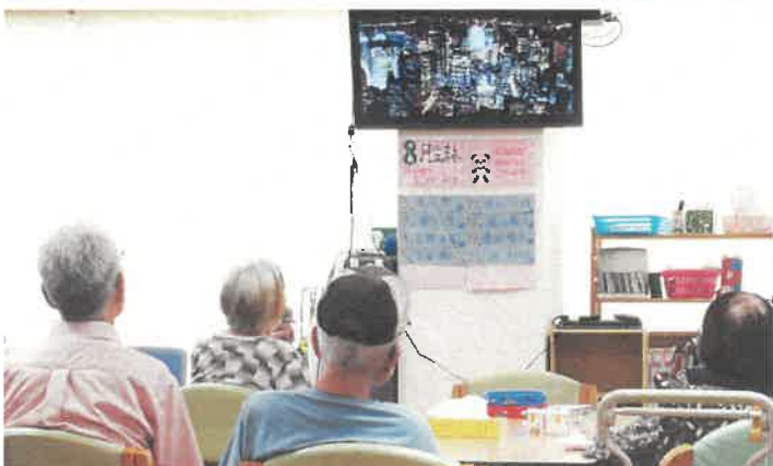
カラオケ風景。一曲いかがですか？