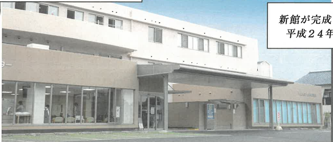
新館が完成 平成24年