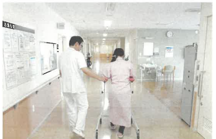
2階病棟での歩行訓練