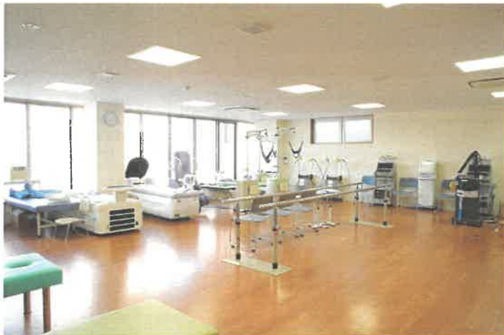
リハビリテーション室フロア