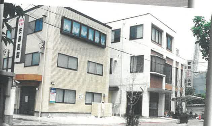
安藤医院が新築工事中（左） 当院旧館は三階建に増築済（右） 平成8年頃