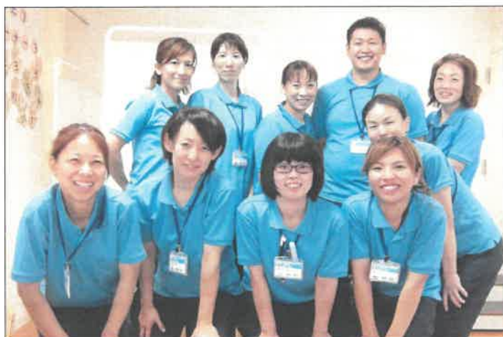
通所リハビリセンター 介護職員