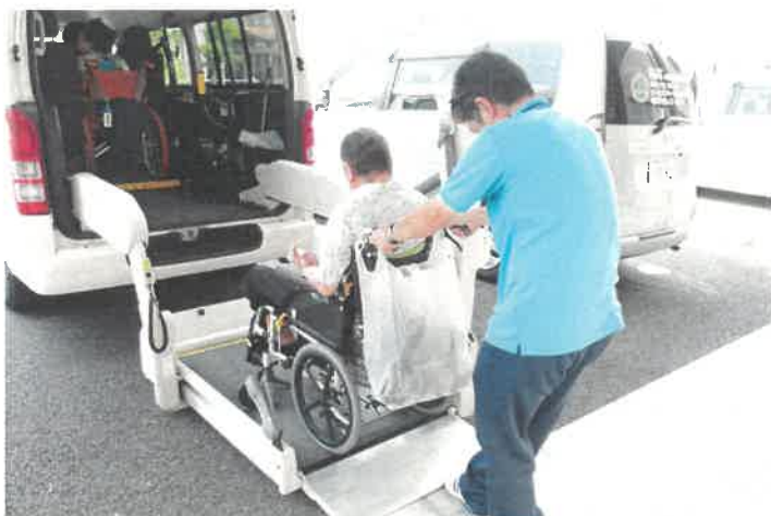
福祉車両で車椅子も安全乗降です！

その他にも各種イベントなどを行っており、通所リハビリセンターには毎日「楽しい」ことがいっぱいです！