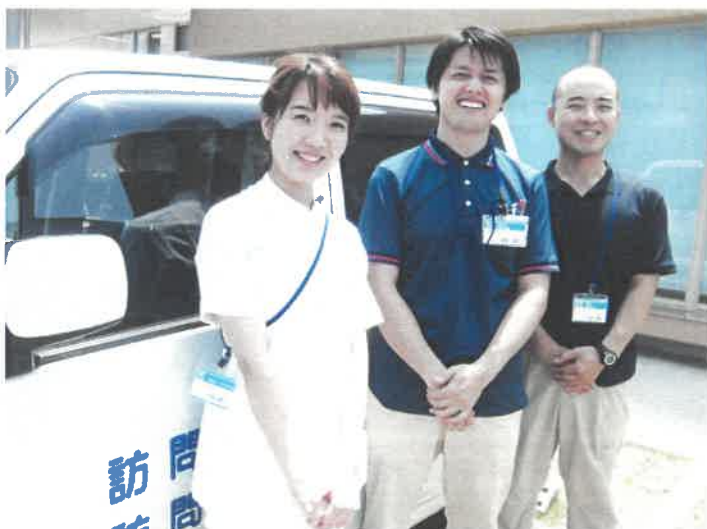
療法士がご自宅まで伺います！

日々の身体状態を把握してわずかな変化も医師へ報告し、医院と連携して利用者様の安全をお守りします。