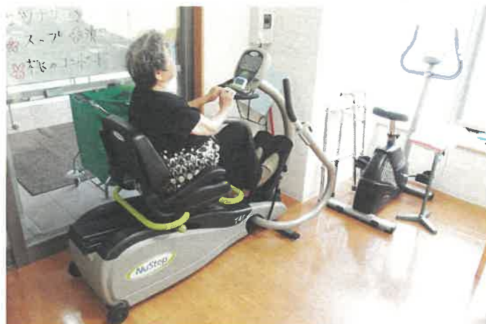
楽しいマシントレーニング