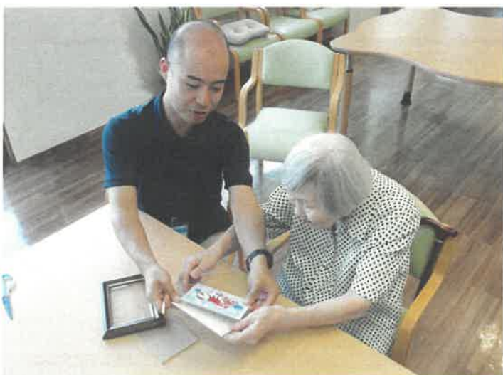
日常生活動作回復訓練