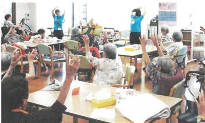
お帰りの前は歌に合わせてみんなで体操