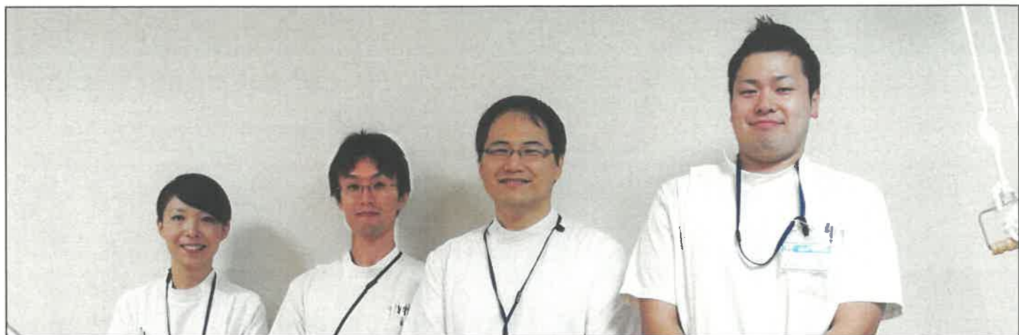
院内リハビリ担当 常勤療法士

当院のリハビリテーション部は、入院・外来の医療部門と、通所リハビリ（デイケア）・訪問リハビリの介護部門があり、それぞれリハビリの専門療法士が一对一での個別療法を行っています。